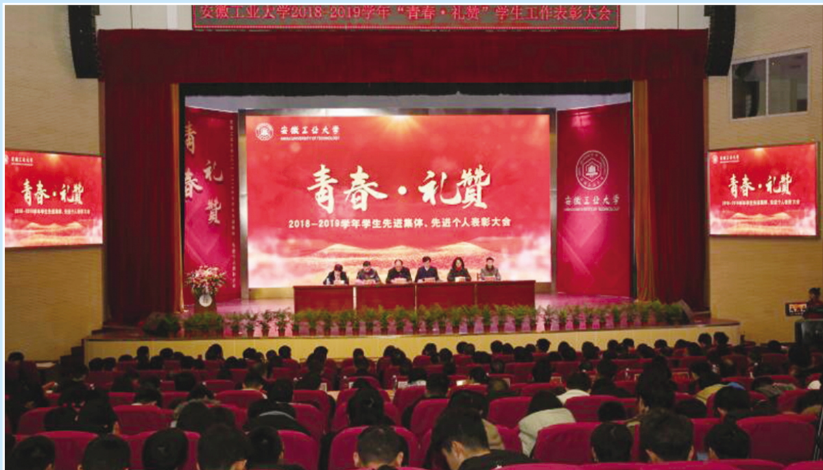
图 片 新 闻

据悉，本年度百篇最具影响国际学术论文是从2018年SCI收录的我国第一作者论文中选取，保证了论文的领先性和在学科中的相对优势。按完成单位统计，我校与北京大学等高校并列全国第10位。（李冉）